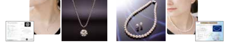
■ダイヤモンドネックレス:ダイヤモンド:色 Gカラー up クラリティSI2 カット詳細 グッドup 長さ45cm(長さを調整できる調節機能付) 6本丸輪PT900/チェーンPT850 中央宝石研究所鑑定書付 ■パールネックレスの長さ 全長42cm(着脱しやすいワンタッチ金具) 珠の大きさ7.5mm~8mm パールイヤリング 7.5mmup 花珠2点セット ネックレス金具:シルバー イヤリング金具K14 ホワイトゴールド 鑑定書付

■ダイヤモンドのネックレスは凛とした輝きを体感できる0.3カラット。チェーンはプラチナです。シンプルなデザインなのでどんなファッションにも合わせやすく装いのグレードを上げてくれます。■パールのネックレスとイヤリングのセットは、真珠の女王といわれるアコヤ真珠の7.5~8mmを使用。フォーマルウエアにも。装いに気品を与えてくれます。いずれも鑑定書付でお届けいたします。